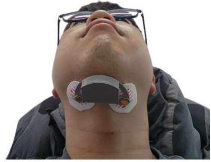
<시제품 착용 사진>